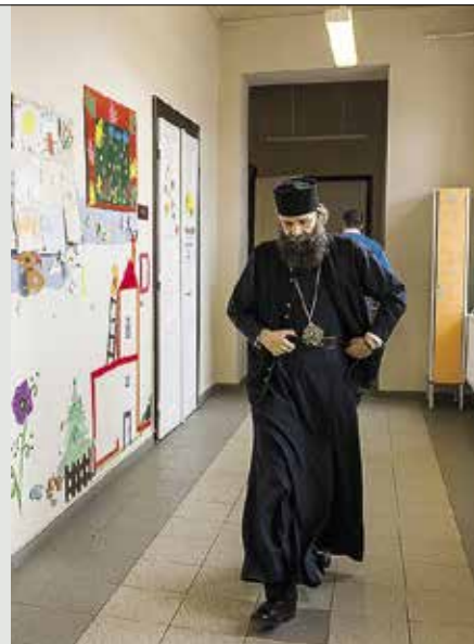
Kocsis Fülöp püspök. Iskolapélida

„Továbbra is törekszünk arra, hogy valódi esélyt adhassunk a hátrányos körülmények között élő családoknak, rászoruló gyermekeknek, és ne csak jogszabályokat teljesítve álmegoldásokat kínáljunk” – így reagált a nyíregyházi Huszár-telepi iskolát fenntartó görög katolikus Hajdúdorogi Egyházmegye a Debreceni Ítéletábra jogerős ítéletére, amely szerint a Sója Miklós Iskolában szegregált oktatás folyt. A cigányok által lakott városrészben működő, tanulói között kizárólag cigány gyermekeket oktató iskolát az előző, szocialista vezetés bezáratta, az ott tanulókat a város iskoláiban helyezték el, ahová iskolabusszal vitték őket. A 2010-es polgármesterváltás után a fideszes vezetés a görög katolikus egyház kezelésébe adta az iskolát, amely olyan felzárkóztató programmal indította újra az oktatást, amelynek magas színvonalát még a szegregáció tényét megállapító