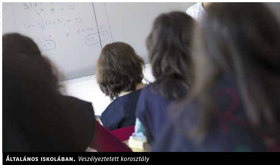
ÁLTALÁNOS ISKOLÁBAN. Veszélyeztetett korosztály

A szigorot a törvényalkotók a gyerekek felgyorsult biológiai fejlődésével és az egyre erőszakosabb érdekérvényesítéssel magyarázták. Adatokkal azonban nem indokolható a módosítás, a gyermekkorú elkövetők száma ugyanis évek óta csökken. Míg 2005-ben 3182, 14 év alatti elkövetőt regisztráltak a hatóságok, 2007-ben 2861-et, 2013-ban pedig 1779-et. Jellemző, hogy a jogvédők által sokat bírált szigorítás elfogadásának évében 2604 volt a még nem büntethető gyermekkorú elkövetők száma, a legkevesebb az utóbbi tíz évben – áll a legfőbb ügyész beszámolójában. Az ügyek többsége nagyon elleni vagy garázdaság, a személy elleni erőszakos cselekmények aránya 10 ▶