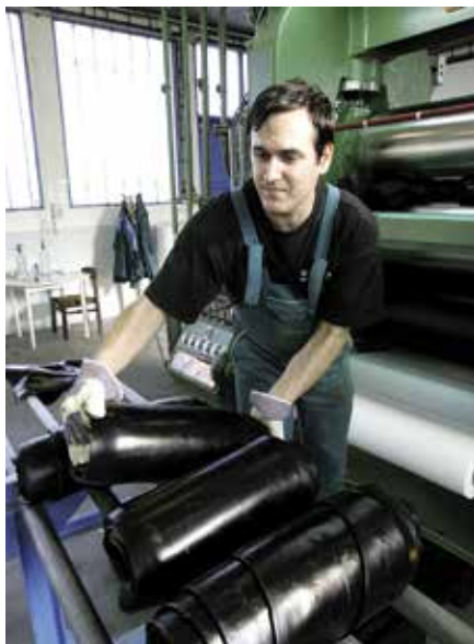
MOTIM-ÜZEMBEN. Épülő cégcsoport

Újabb nemzetközi kötelezettségét szegi meg a kormány azzal, hogy nem enged a büntethetőség jelenlegi 12 éves korhatárából.