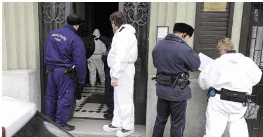
HELYSZÍNELÉS A VASÁRNAPI CSECSEMŐGYILKOSSÁG UTÁN. Agresszió és tréning