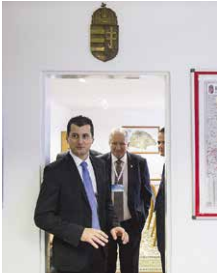
A MINISZTERELNÖKSÉG MÚLT HÉTEN MEGNYÍLT KECSKEMÉTI ÁLLAMTITKÁRSÁGA. Térfoglalás

Ilyenekről most szó sem lehet. A hódmezővásárhelyiektől 2012-ben Orbán által személyesen „kikért”, a Miniszterelnökséget a választásokig államtitkárként irányító Lázár tárcája ma már jóval több, mint a miniszterelnök munkaszervezete: afféle kormány a kormányban, első az egyenlők között. Lázárt kilenc államtitkár, 23 helyettes államtitkár, négy kormánybiztos és megszámlálhatatlanul sok tanácsadó segíti. A múlt héten például Habony Árpádról derült ki, hogy ő is onnan kapta állandó parlamenti belépőjét, miközben formálisan nem is áll a Miniszterelnökség szolgálatában.