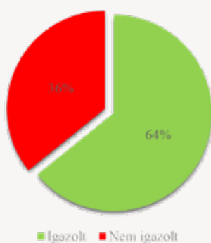
Be. 479. § (5) bekezdés

(A tájékoztatási kötelezettség igazolt teljesítése döntően két tanácshoz kötődött)